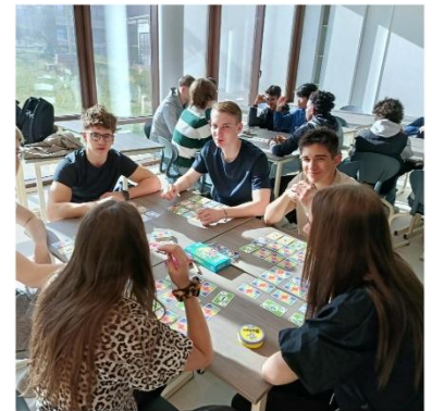
In unserer Partnerschule, dem Lycée Charles de Foucauld Eine deutsch-französische Aktivität, um das Eis zu brechen und miteinander ins Gespräch zu kommen.